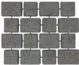
คาร์เพ็ทสโตน รุ่นไททัน ผิวพ่น สีดำเทา Black Grey