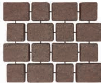
คาร์เพ็ทสโตน รุ่นไททัน ผิวพ่น สีแดง Dark Red