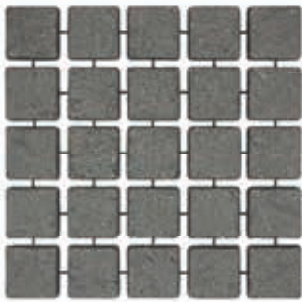
คาร์เพ็ทสโตน รุ่นลอคเวร์ ผิวพ่น สีดำเทา Black Grey