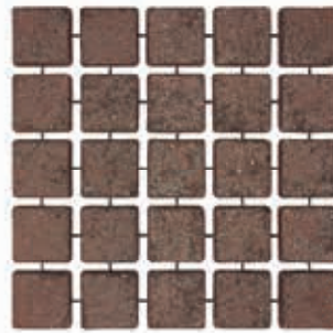
คาร์เพ็ทสโตน รุ่นลอคเวร์ ผิวพ่น สีแดง Dark Red